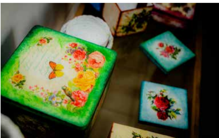
FOT. KERTINGUSZ NARUSZEWICZ