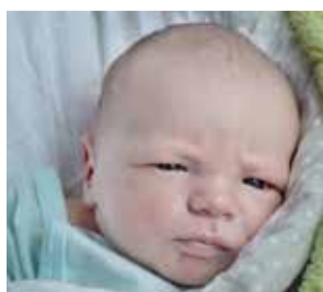
Jan Gowin 11 kwietnia 2018